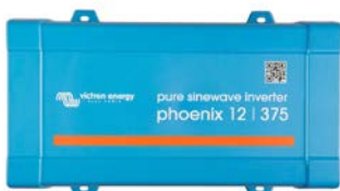
Phoenix 12/375 VE.Direct