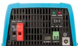
Phoenix 12/375 VE.Direct